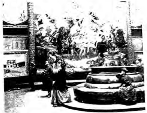
Abb. 1 Blick in den Cornelius-Saal der Berliner Nationalgalerie, Fotografie, 1897; links Oswald Achenbachs Gemälde »Der Triumphbogen des Konstantin in Rom« von 1886 (Kat. Düsseldorf 1997, S. 39)