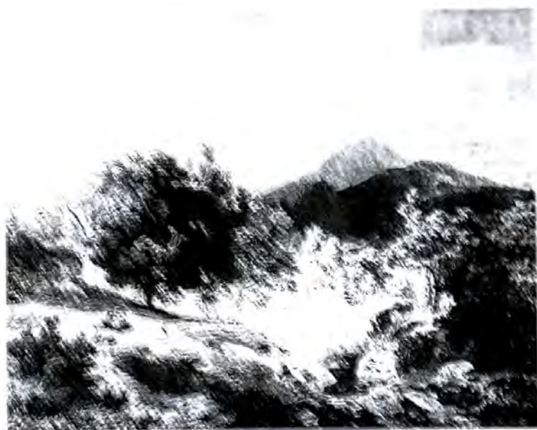
Abb. 2 Andreas Achenbach, Römische Landschaft, 1844, Öl/Lwd., 74,5 x 100 cm, Düsseldorf, Kunstmuseum (Kat. Düsseldorf 1997, S. 80)